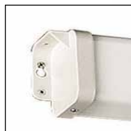
Detail oben links